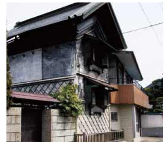
平塚家見世蔵(高部)