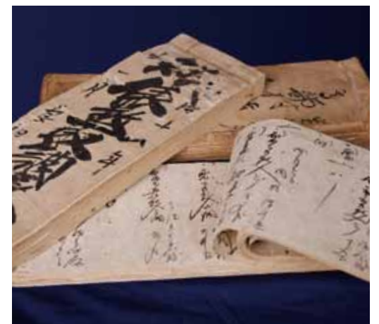
大森家古文書(高部)