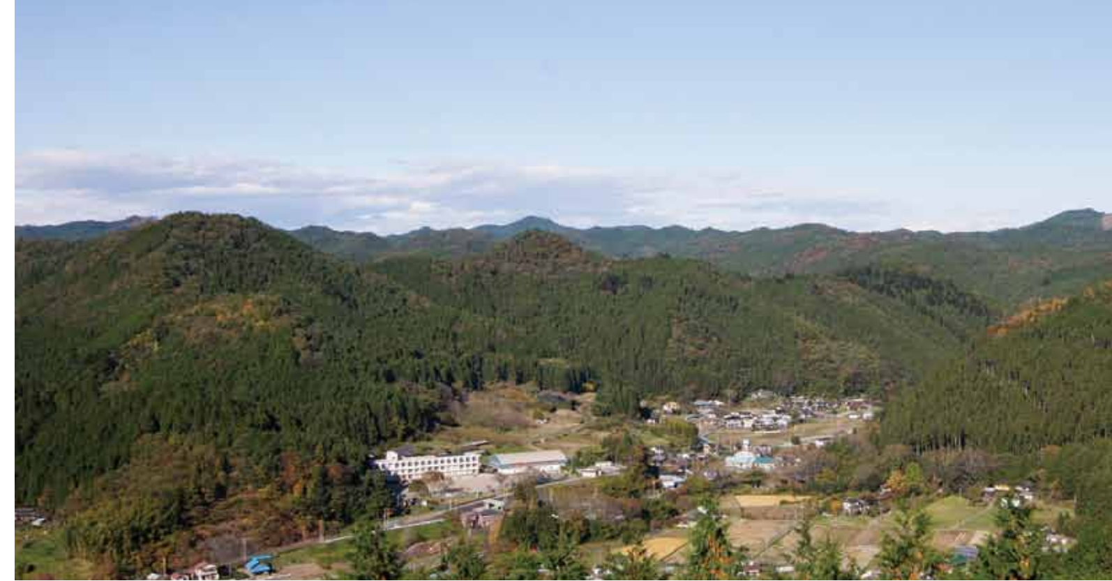
花立自然公園からの眺望

発行 森と地域の調和を考える会 龍崎 真一 川野 和彦 大森 豊 堀江 克己 河西 和文 薄井 均 清水 浩 TEL.0295-58-3812 http://miwa-mori.wix.com/miwa 2015年3月発行