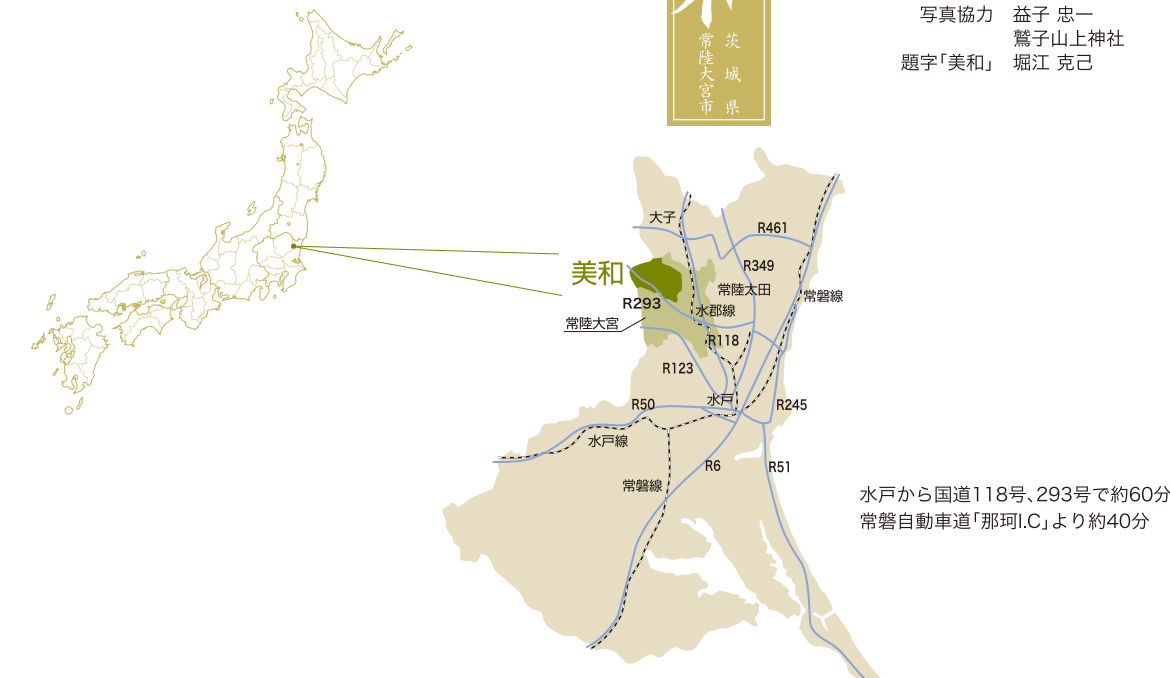
題字「美和」 堀江 克己