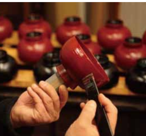
地元で作られる漆器