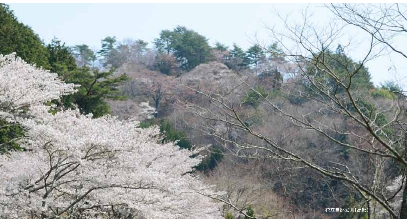
花立自然公園(高部)