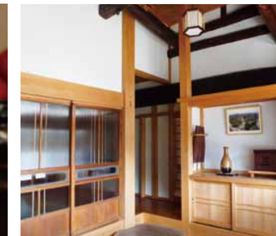
地元の檜を使った日本家屋