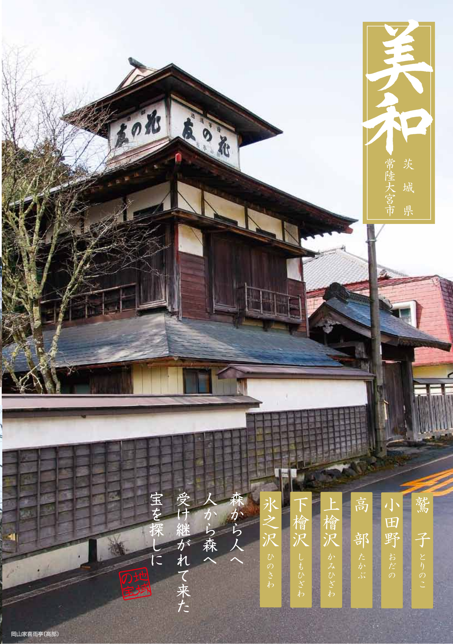
岡山家喜雨亭(高部)